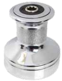
EVO® Sport Winch Chrome