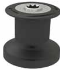
EVO® Sport Winch Black Size 7