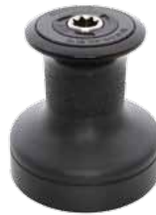
EVO® Sport Winch Black